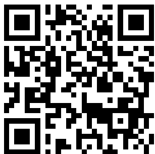
※汽車通行證網頁申請