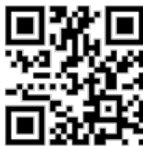
※機車通行證網頁申請